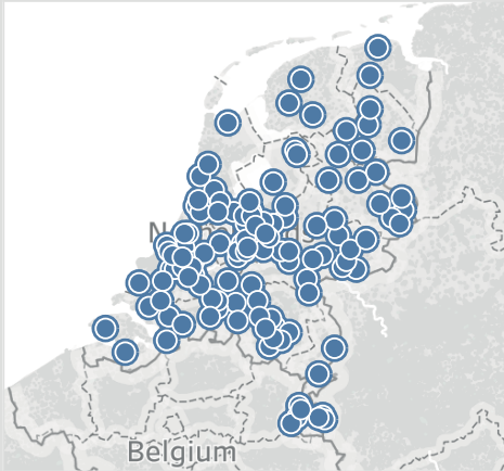
VGM NL Database 2017